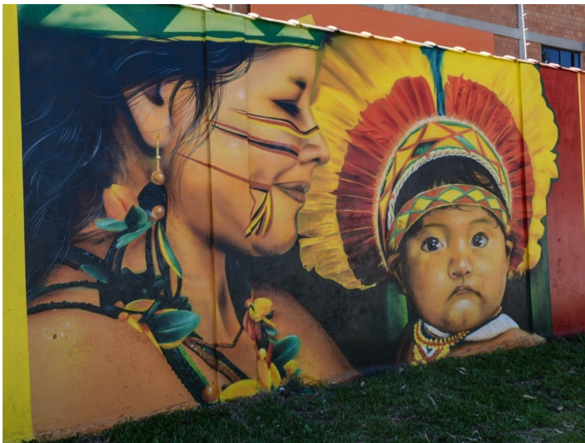
Muro fica em uma das avenidas mais movimentadas de Pinhais, na Região Metropolitana de Curitiba.

Ontem conhecemos parte da obra do artista de rua Marcelo Diamont, no muro de 144 metros de comprimento e quase três metros de altura, às margens de uma das avenidas mais movimentadas de Pinhais, na Região Metropolitana de Curitiba – PR.