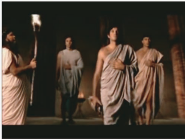
Olimpíadas da Grécia Antiga