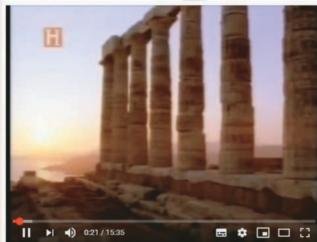
Olimpíadas na Antiguidade