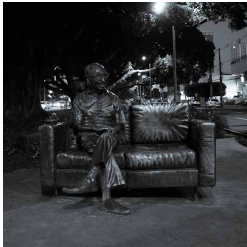
Campo Grande, Mato Grosso do Sul - MS, Brasil

Enciclopédia Itaú Cultural. Disponível em: http://enciclopedia.itaucultural.org.br/pessoa4029/manoel-de-barros Acesso em 17 jun. 2020