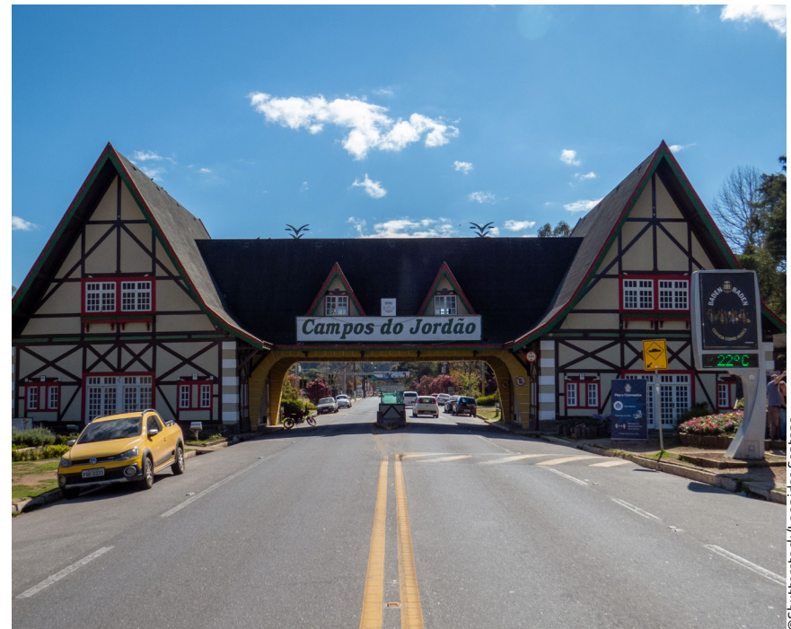
Campos do Jordão - região serrana, clima tropical de altitude