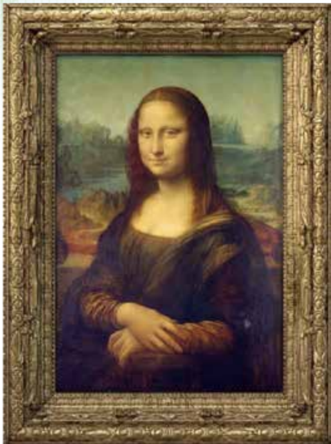
DA VINCI, LEONARDO. MONALISA, 1503-1506.

ATIVIDADE 3: UMA DE SUAS PINTURAS MAIS FAMOSAS É O QUADRO MONALISA . APRECIE A IMAGEM. ESCOLHA ALGUÉM QUE GOSTARIA DE PINTAR E, UTILIZANDO GIZ DE CERA, LÁPIS DE COR OU CANETINHA, CRIE SUA OBRA.