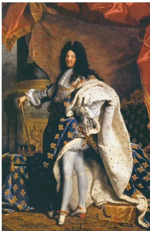
RIGAUD, Hyacinthe. Retrato de Luís XIV . 1701. 1 óleo sobre tela, 277 cm × 194 cm. Museu do Louvre, Paris.

Absolutismo – dado ao fato que o poder deveria ser centralizado na figura real, todas as decisões políticas ficavam sob responsabilidade do rei; ele não deveria prestar contas de seus atos a ninguém. Assim, todas as vontades do rei eram obedecidas e muitas delas inclusive se tornaram leis do próprio país.