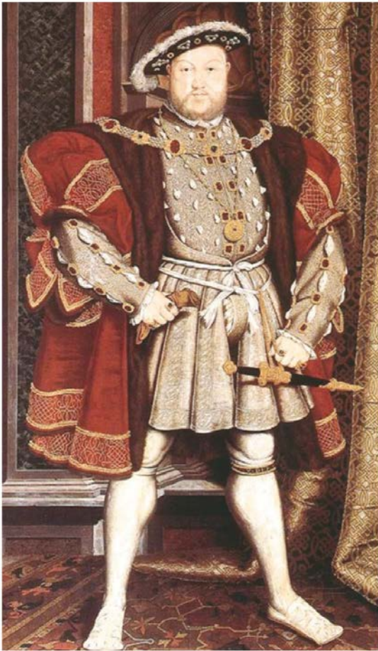
HOLBEIN, Hans o Jovem. Henrique VIII , após 1537. 1 óleo sobre tela. 233,7 cm × 134,6 cm. Walker Art Gallery, Liverpool.

Nesta classe estavam os camponeses, burgueses e artesões. Comandando toda essa estrutura estava o rei, dito líder abençoado pela igreja católica. O sistema político regido era o absolutismo, onde existia a figura do monarca como centro. O rei detinha os poderes do Judiciário, Executivo e Legislativo de uma só vez.